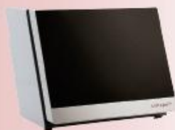
販売名 C-Pro デンタルシステム 歯科技工室設置型コンピュータ支援設計・製造ユニット 医療機器届出番号：27B2X00013000005