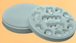
販売名 C-Pro HT ジルコニア 歯科切削加工用セラミックス 医療機器認証番号：224AABZX00149000 【製造販売元】パナソニックヘルスケア株式会社