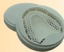
販売名 C-Pro ナノジルコニア 歯科切削加工用セラミックス 医療機器認証番号：221AABZX00156000 【製造販売元】パナソニックヘルスケア株式会社